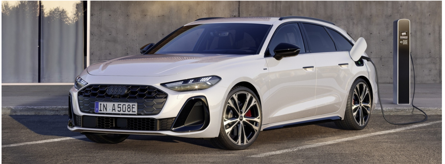
z.B. Audi A5 Avant e-hybrid quattro 220(299) kW(PS) S tronic Automatikgetriebe