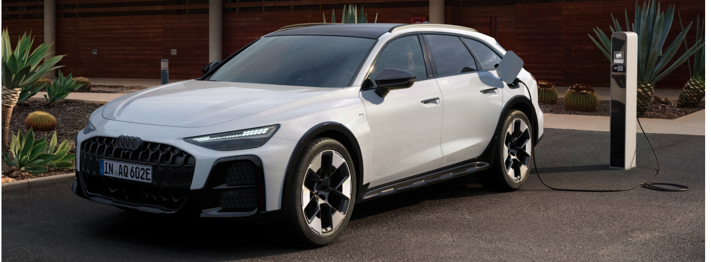
z.B. Audi A6 allroad e-hybrid quattro 270(367) kW(PS) Benziner Plug-In Hybrid S tronic Automatikgetriebe