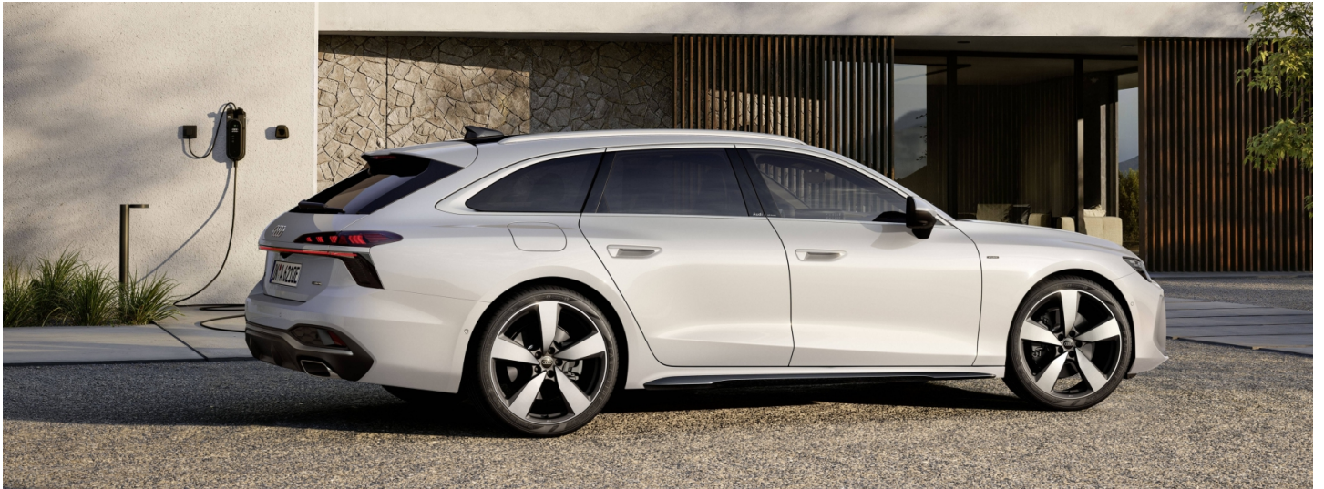
z.B. Audi A6 Avant e-hybrid quattro 220(299) kW(PS) Benziner Plug-In Hybrid S tronic Automatikgetriebe