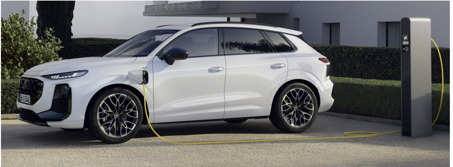
z.B. Audi Q3 SUV e-hybrid 200(272) kW(PS) Hybrid S tronic Automatikgetriebe