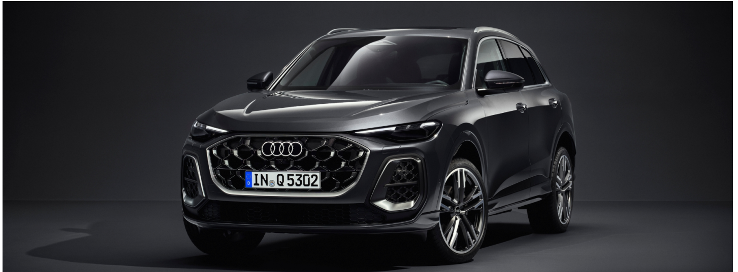
z.B. Audi Q5 TFSI 150(204) kW(PS) S tronic Automatikgetriebe Benziner