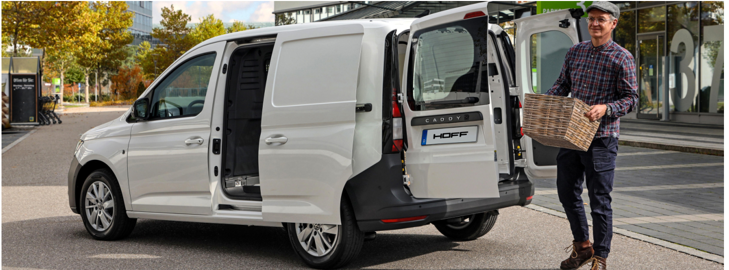
z.B. Caddy Cargo 1,5 | TSI EU6 85 kW Getriebe: 6-Gang- Schaltgetriebe Radstand: 2755 mm