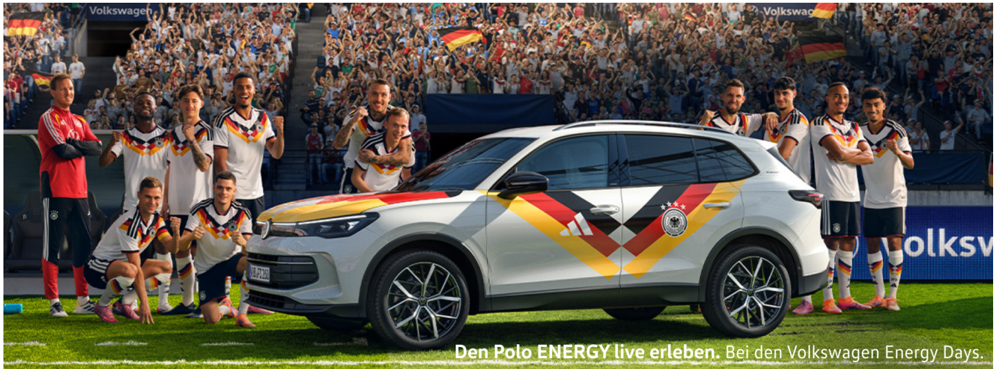
Den Polo ENERGY live erleben. Bei den Volkswagen Energy Days.

z.B. Polo ENERGY 1,0 | 59 kW (80 PS) 5-Gang