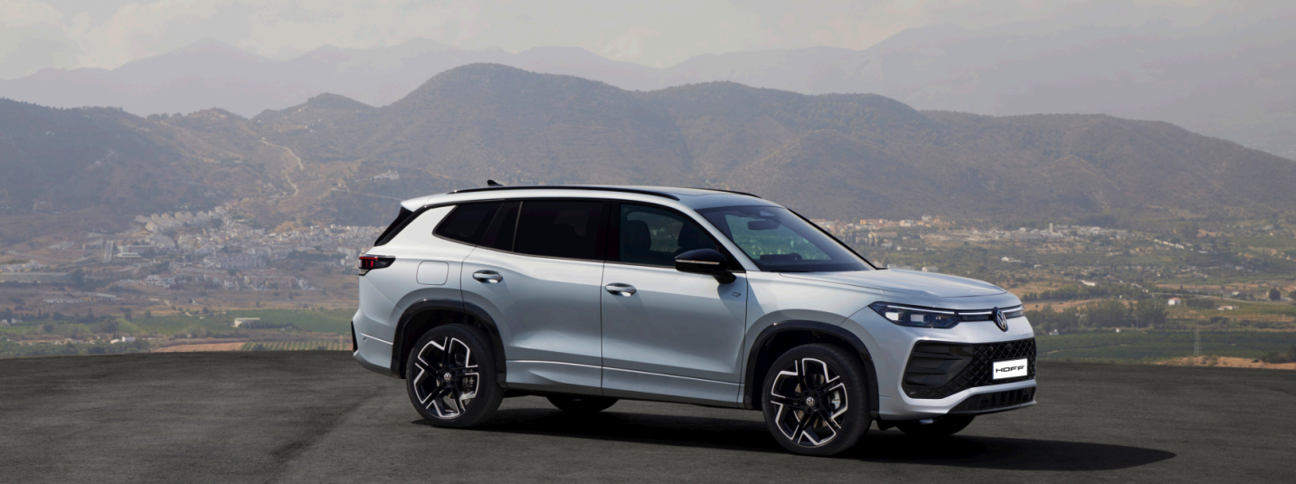
z.B. Tayron R-Line 1,5 l eHybrid OPF 110 kW (150 PS) / 85 kW (115 PS) 6-Gang-Doppelkupplungsgetriebe DSG