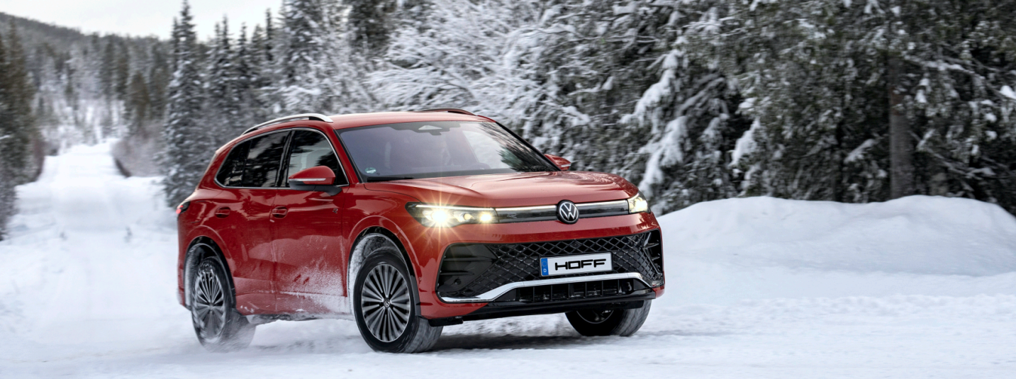
z.B. Tiguan R-Line 1,5 l eTSI OPF 110 kW (150 PS) 7-Gang- Doppelkupplungsgetriebe DSG