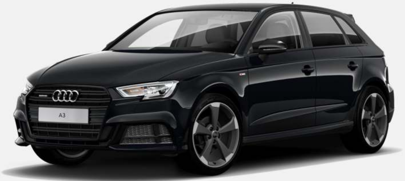
Abbildung enthält Sonderausstattungen gegen Aufpreis