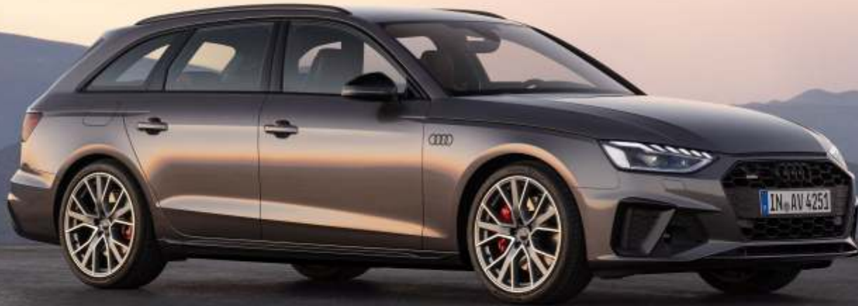
Abbildung enthält Sonderausstattungen gegen Aufpreis