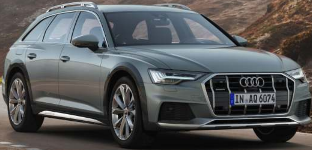
Abbildung enthält Sonderausstattungen gegen Aufpreis

Audi A6 allroad quattro 45 TDI 170(231) kW(PS) tiptronic