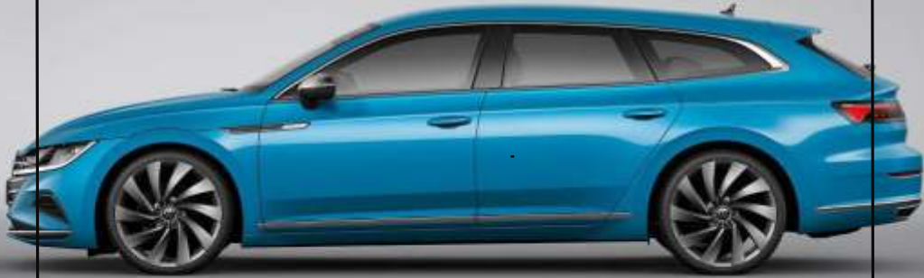
Abbildung zeigt Sonderausstattungen gegen Mehrpreis 1