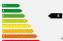
Q3 advanced 35 TFSI S tronic 110(150) kW(PS)

Kraftstoffverbrauch nach 99/94/EG in l/100 km: primär: innerorts 6,0/ außerorts 4,6/ kombiniert 5,1/CO2 -Emission g/km: 117, Energieeffizienz: B