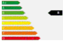
Q2 30 TFSI 85(116) kW(PS) 6-Gang

> alle Fahrzeuge mit Euro 6d-TEMP Abgasnorm > sofort lieferbar & stark reduziert > nur noch bis 31.01.2019