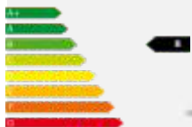
A3 Sportback sport 30 TFSI 85(116) kW(PS) 6-Gang

Kraftstoffverbrauch nach 99/94/EG in l/100 km: primär: innerorts 6,0/ außerorts 4,6/ kombiniert 5,1/CO2 -Emission g/km: 117, Energieeffizienz: B