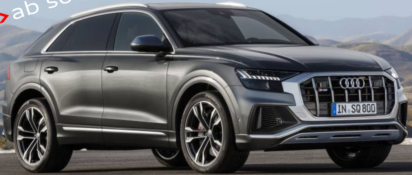
Abbildung enthält Sonderausstattungen gegen Aufpreis