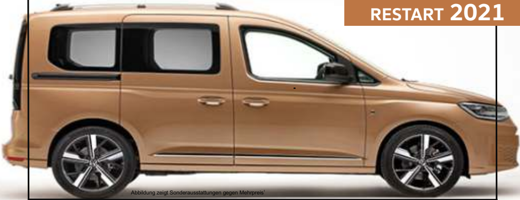
Abbildung zeigt Sonderausstattungen gegen Mehrpreis 1