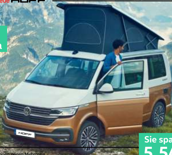
Abbildung zeigt Sonderausstattungen gegen Mehrpreis