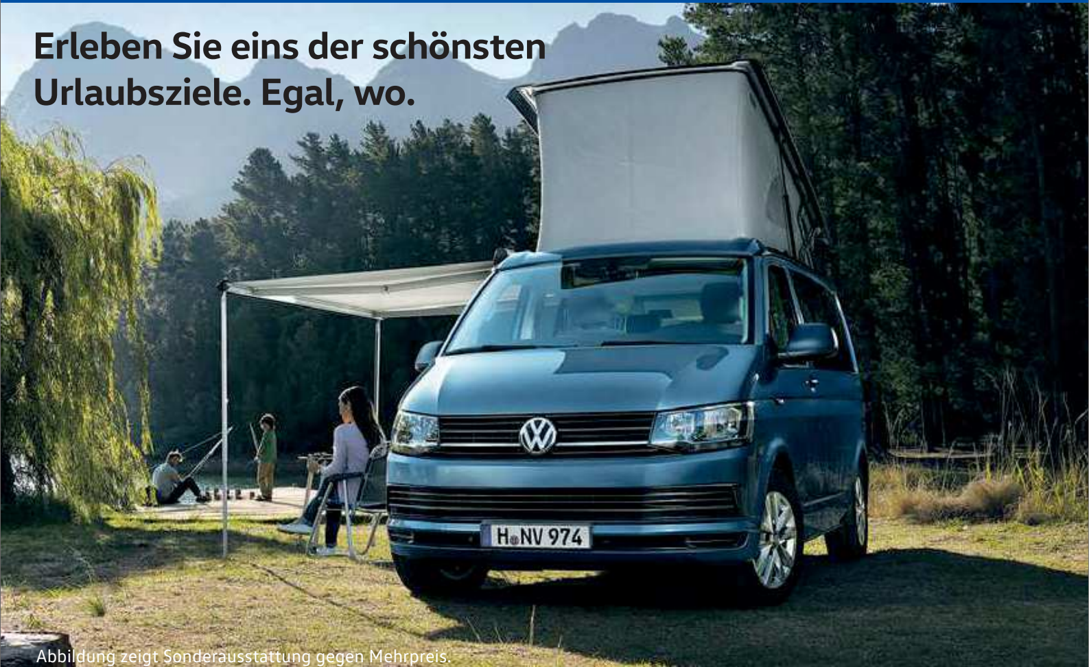
Abbildung zeigt Sonderausstattung gegen Mehrpreis.

Erleben Sie eins der schönsten Urlaubsziele. Egal, wo.