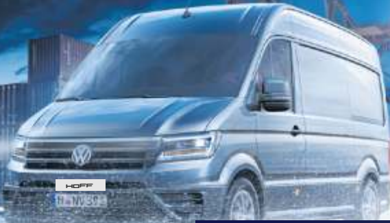
Abbildung zeigt Sonderausstattungen gegen Mehrpreis

Der Crafter EcoProfi. inkl. Exklusiv Sonderleasing