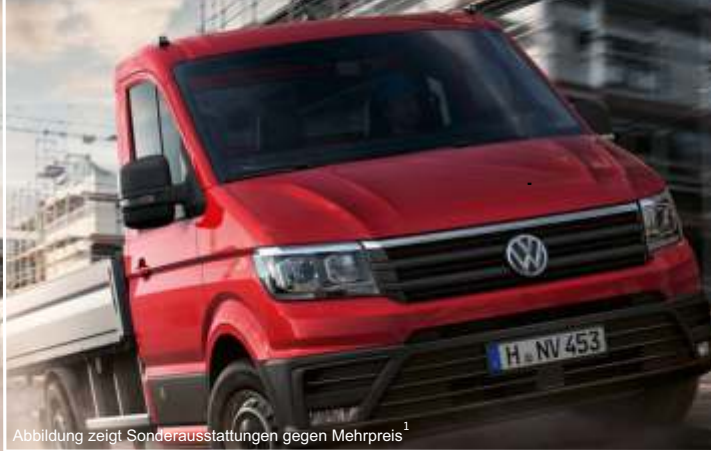
Abbildung zeigt Sonderausstattungen gegen Mehrpreis 1