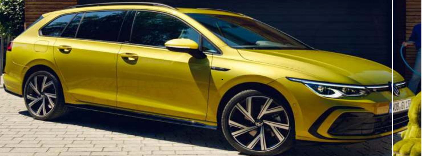
Abbildung zeigt Sonderausstattungen gegen Mehrpreis 1