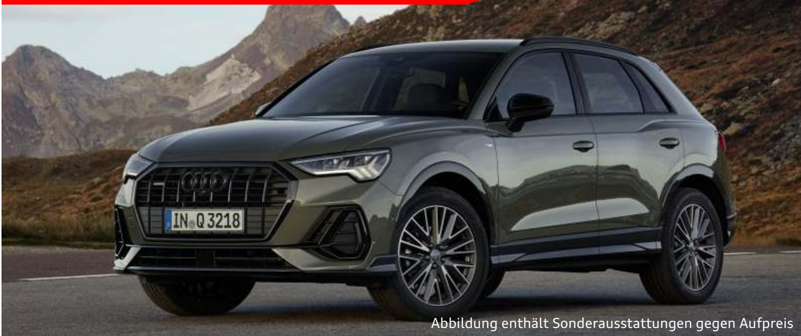
Abbildung enthält Sonderausstattungen gegen Aufpreis