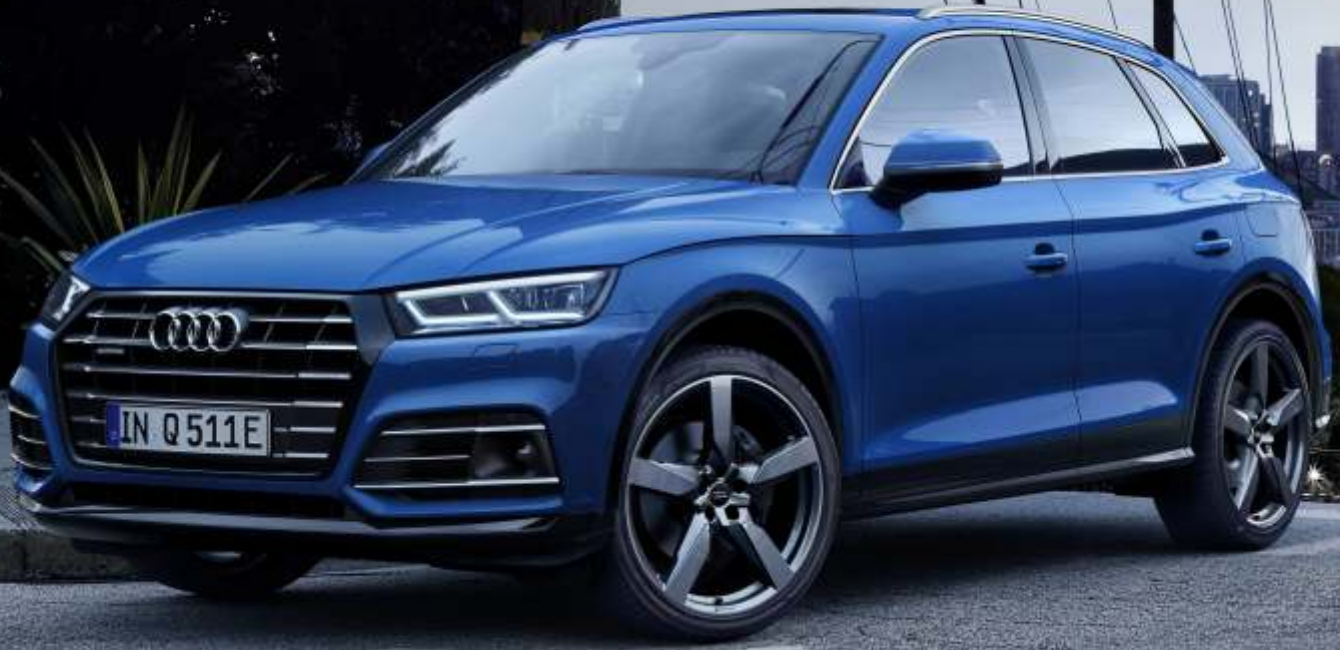
Abbildung enthält Sonderausstattungen gegen Aufpreis