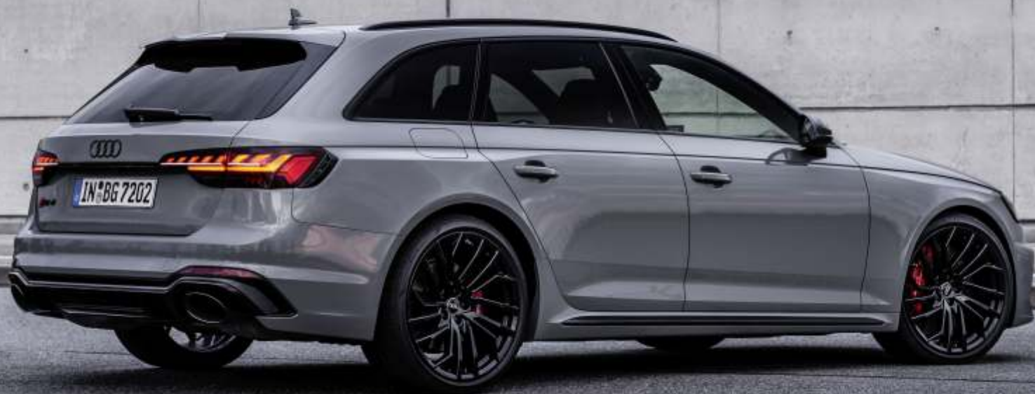
Abbildung enthält Sonderausstattungen gegen Aufpreis