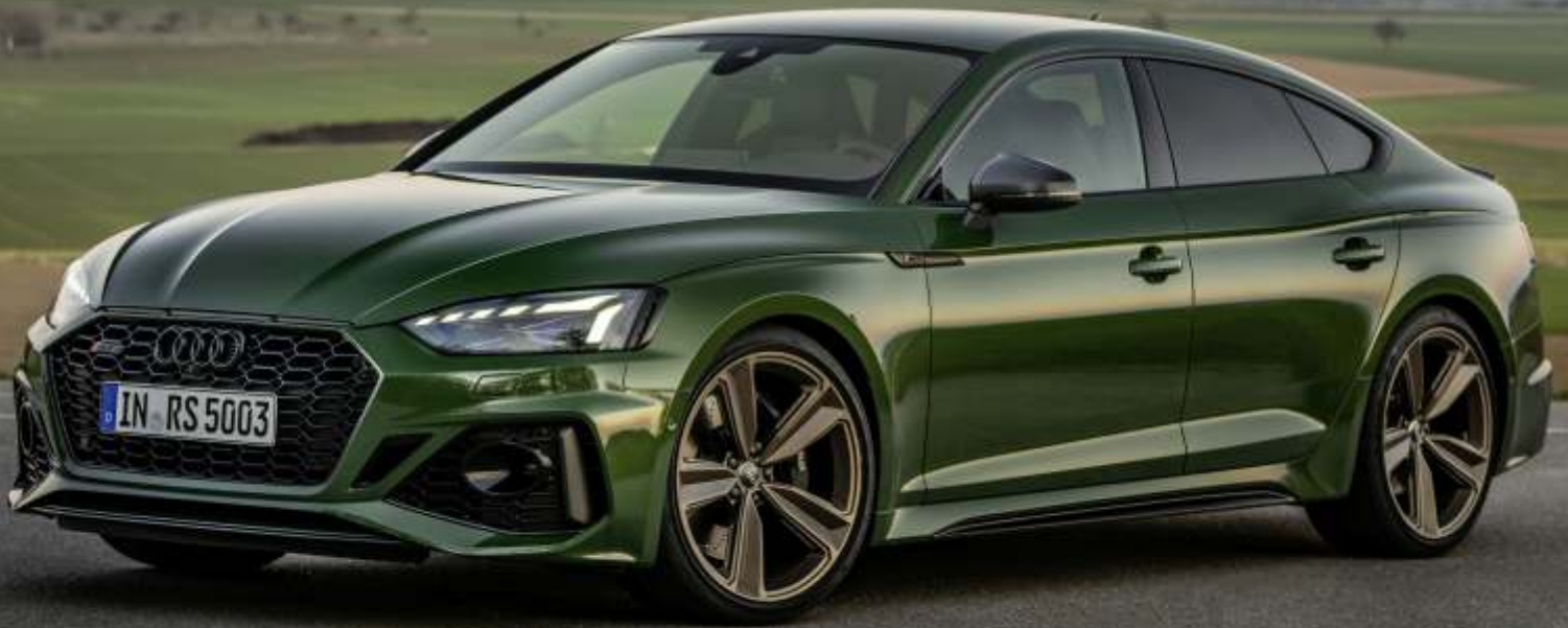
Abbildung enthält Sonderausstattungen gegen Aufpreis