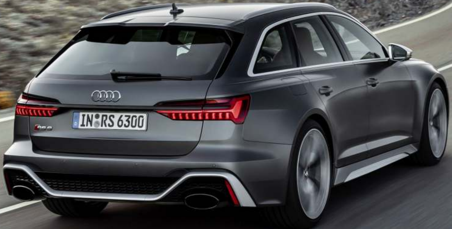
Abbildung enthält Sonderausstattungen gegen Aufpreis