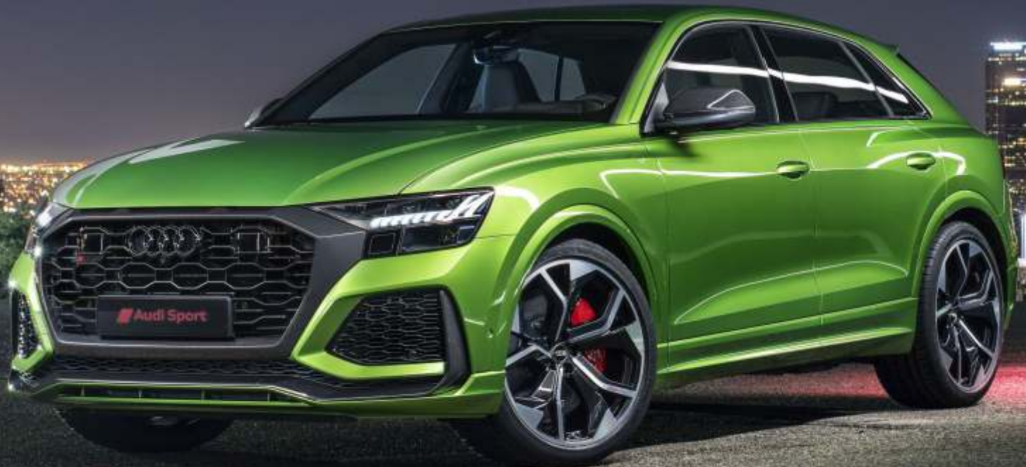
Abbildung enthält Sonderausstattungen gegen Aufpreis