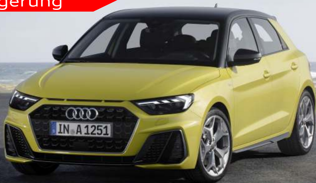
Abbildung enthält Sonderausstattungen gegen Aufpreis