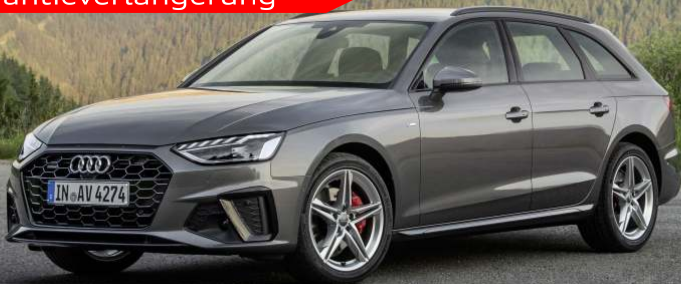
Abbildung enthält Sonderausstattungen gegen Aufpreis