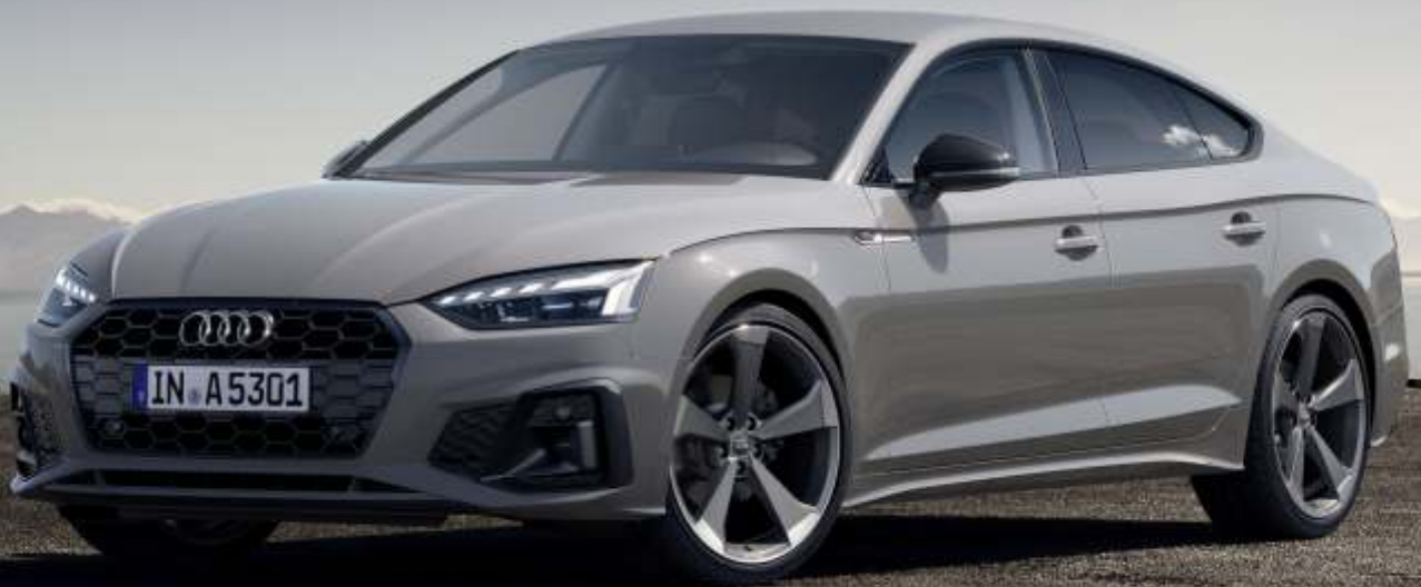
Abbildung enthält Sonderausstattungen gegen Aufpreis