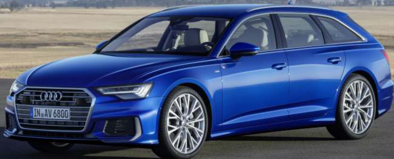
Abbildung enthält Sonderausstattungen gegen Aufpreis