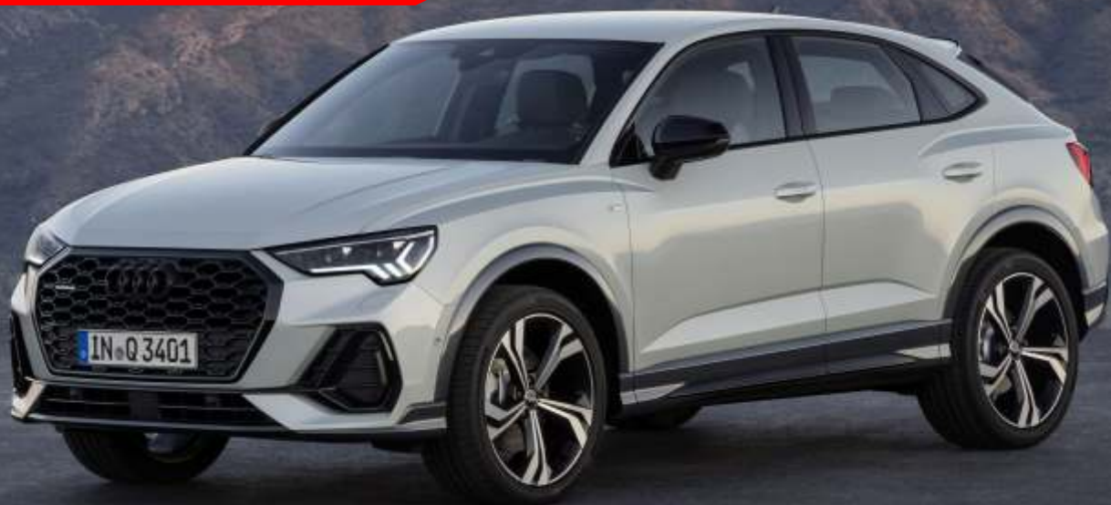
Abbildung enthält Sonderausstattungen gegen Aufpreis