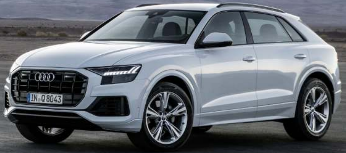
Abbildung enthält Sonderausstattungen gegen Aufpreis