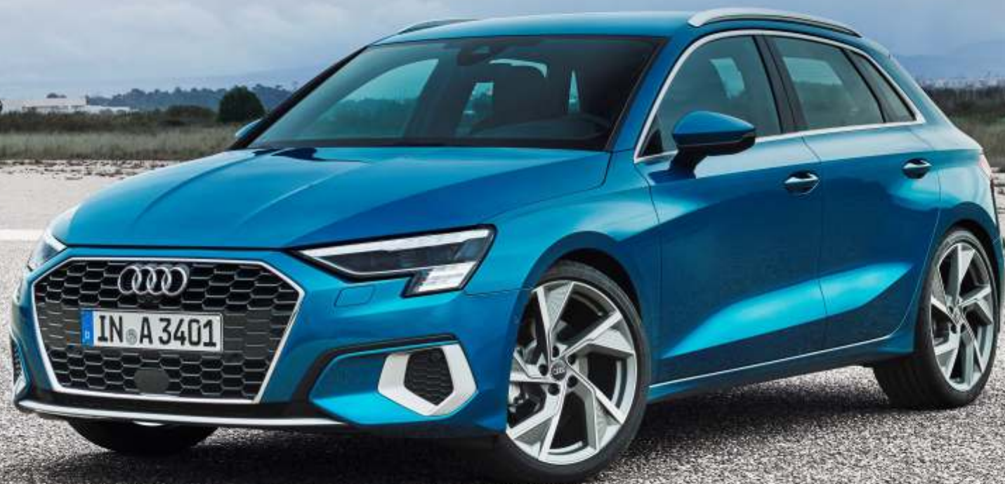
Abbildung enthält Sonderausstattungen gegen Aufpreis