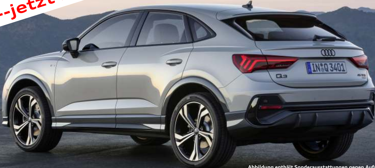
Abbildung enthält Sonderausstattungen gegen Aufpreis