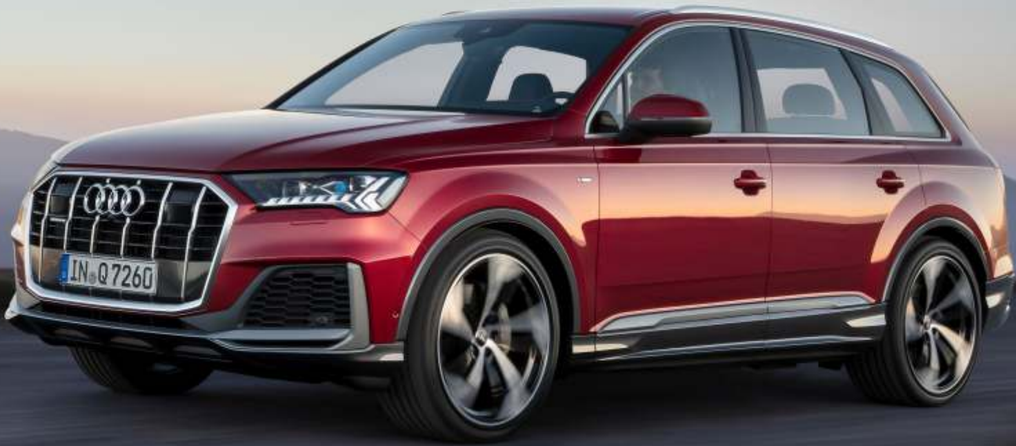
Abbildung enthält Sonderausstattungen gegen Aufpreis