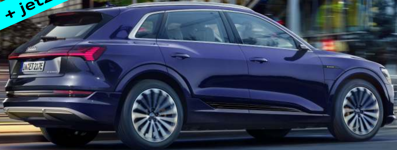
Abbildung enthält Sonderausstattungen gegen Aufpreis