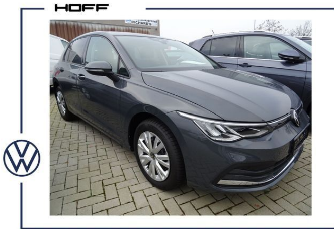
Sandro Ebel Verkauf Neuwagen